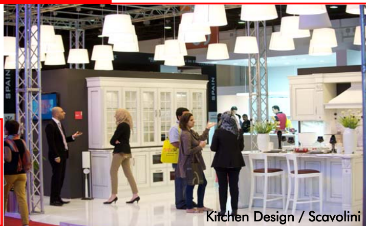
Kitchen Design / Scavolini