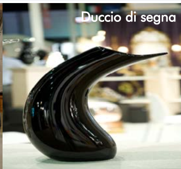
Duccio di segna