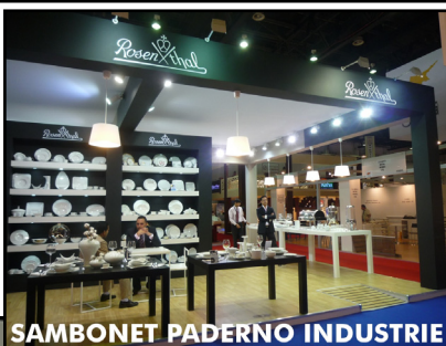
SAMBONET PADERNO INDUSTRIE