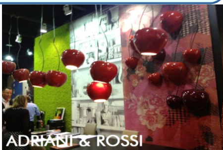
ADRIANI & ROSSI